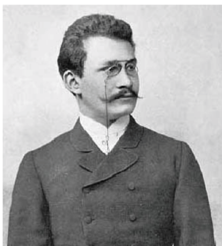
Figura 1- Hermann Minkowski (1864-1909)

Uma das descobertas fundamentais da física do século XX deve-se ao matemático alemão Hermann Minkowski, que em 1908 compreendeu que a recém-descoberta Teoria da Relatividade podia ser reformulada como uma nova geometria num espaço-tempo a quatro dimensões.