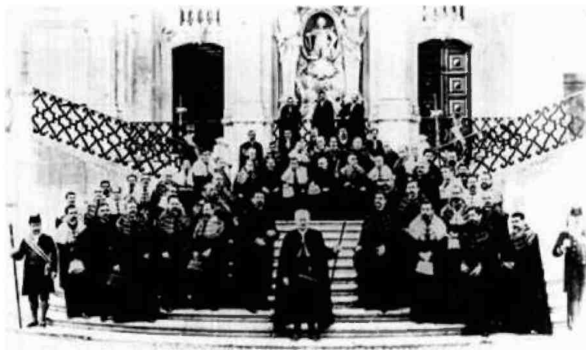
GRUPO DE PROFESSORES DE PRINCÍPIOS DO SEC. XX